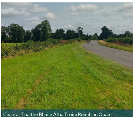
Ceantar Tuaithe Bhaile Átha Troim Roimh an Obair