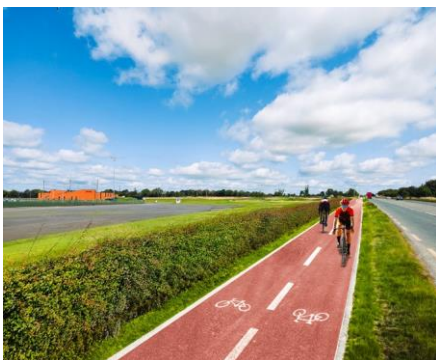
Dunganny (Ionad Bairr Feabhais CLG) Tar éis na hOibre