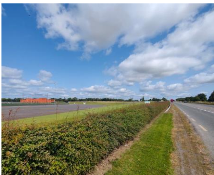
Dunganny (Ionad Bairr Feabhais CLG) Roimh an Obair