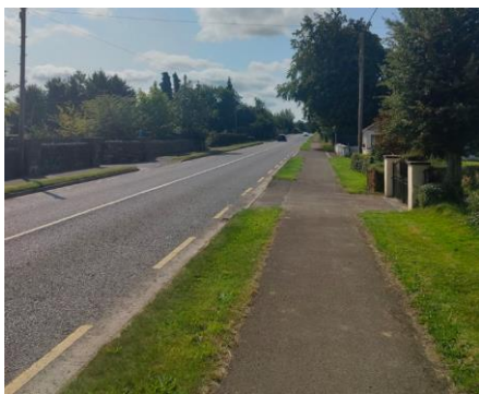
Teorainn Uirbeach na hUaimhe Roimh an Obair