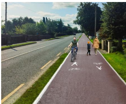
Teorainn Uirbeach na hUaimhe Tar éis na hOibre