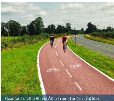
Ceantar Tuaithe Bhaile Átha Troim Tar éis na hOibre